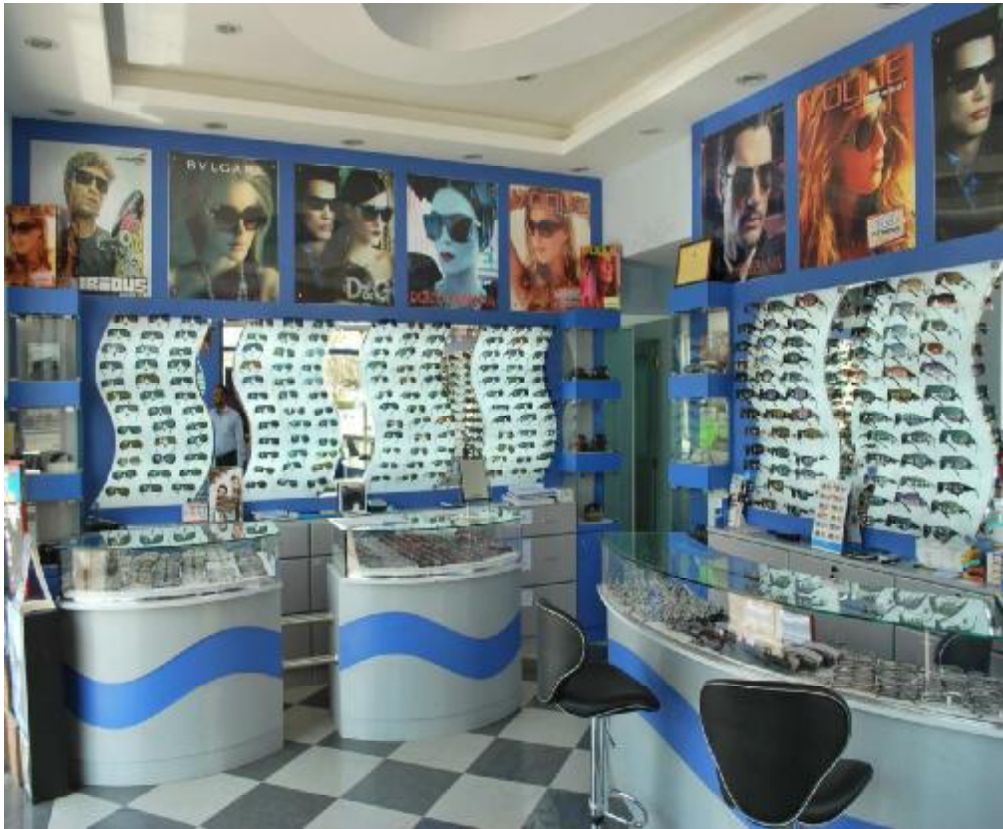
Clinic Sultan Opticals Bausher Branch:-