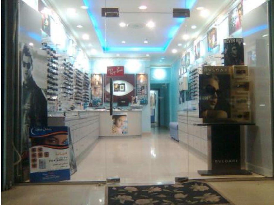
Clinic Sultan Opticals Alkhuwair Branch:-