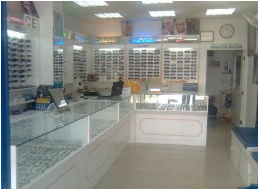
Showroom Prism Optical Dubai